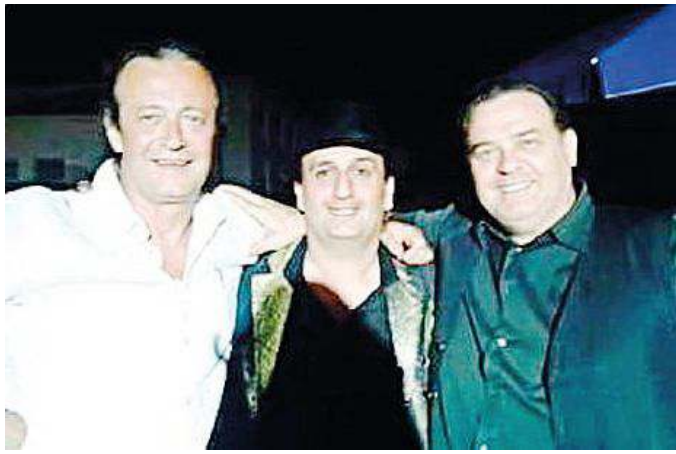
I protagonisti della serata a Calambrone